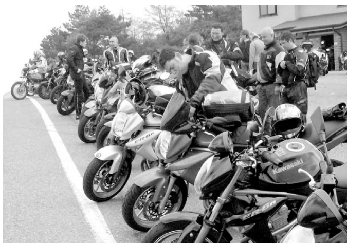
Un momento della passata edizione del Mototortello

La giornata di oggi partirà alle 9 con l'apertura delle iscrizioni. I centauri dovranno presentarsi col pieno di benzina - a