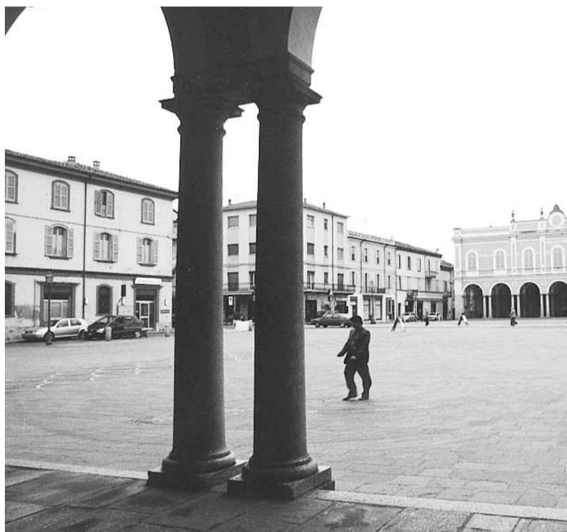
Uno scorcio di Castelsangiovanni

Nel corso del 2010 è previsto che il gestore del servizio (Enia) estenda il porta a porta anche nelle frazioni di Creta e Ganaghello. Proseguirà la raccolta del cartone per le utenze commerciali del centro storico e del vetro presso gli esercizi pubblici. Nel contratto è ovviamente compreso lo spezzamento di vie e piazze con attenzione alle aree del mercato (giovedì e domenica).