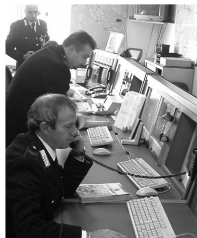
Sopra, la sala operativa dei carabinieri e, a destra, una pattuglia