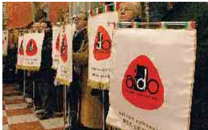
Labari sezionali dell'Associazione italiana donatori di organi

Vengono donate per successivi trapianti le due cornee, le valvole cardiache, i segmenti vascolari e parte del tessuto osseo. Tutti strumenti preziosi - alcuni essenziali - per il corpo umano. Con le cornee si permette a due persone di vedere; le valvole cardiache si usano per i