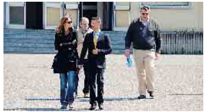
La delegazione sindacale ieri all'uscita dalle Novate

CARCERE - Sopralluogo ieri nella struttura