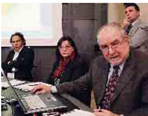
Un momento del convegno di ieri, focus sugli infortuni sul lavoro