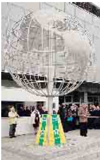
Il monumento dei maestri del lavoro

L'onoreficenza è conferita con un decreto del presidente della Repubblica su proposta del ministro del Lavoro (e, per quelle riservate ai lavoratori all'estero, di concerto col ministro degli Esteri). Viene concessa a cittadini italiani che abbiano compiuto i 50 anni di età, abbiano prestato attività lavorativa ininterrottamente per almeno 25 anni alle dipendenze di una o più aziende